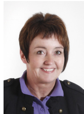
Else Ammentorp Veterinärdiagnostik